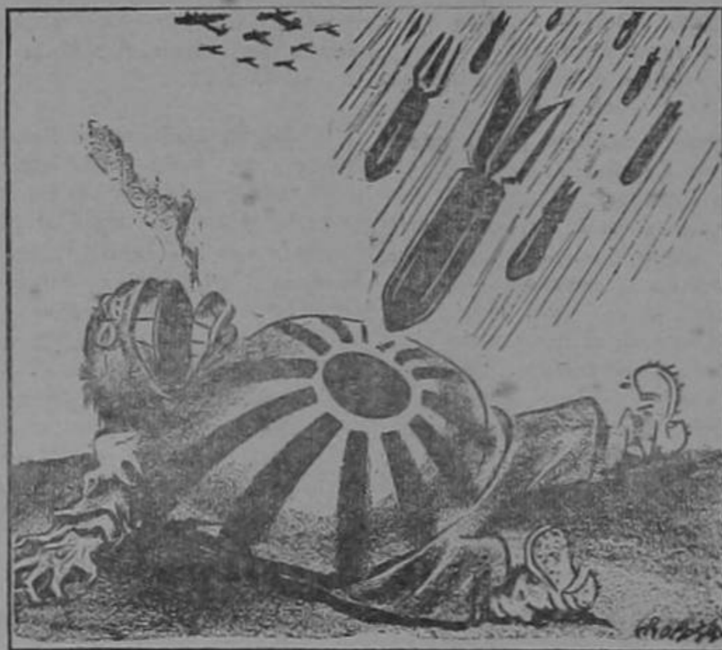
LO QUE NO DIJO EL COMUNICADO OFICIAL JAPONES...

—¿Crees que voy a llevar esta piel de nutria toda la vida?