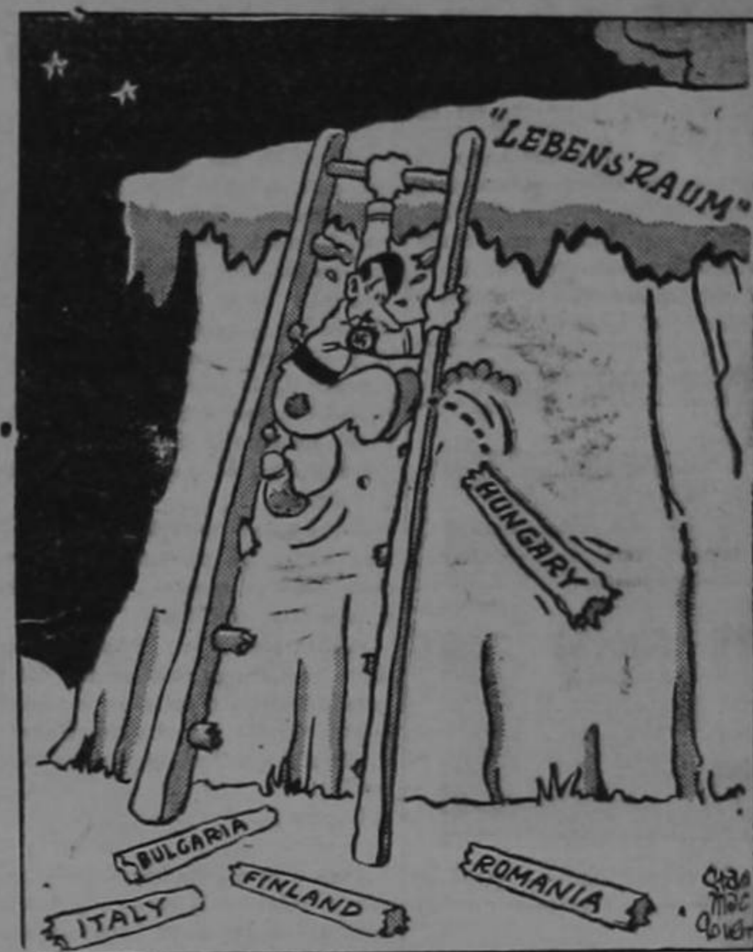
LOS PELDANOS DE LA VICTORIA ALEMANA

Y me quedé pensando yo en las pedrojas de la medicina. ¿Cómo fue ella la castigada por aquel beso, y no el marido que tal esperpento besaba?