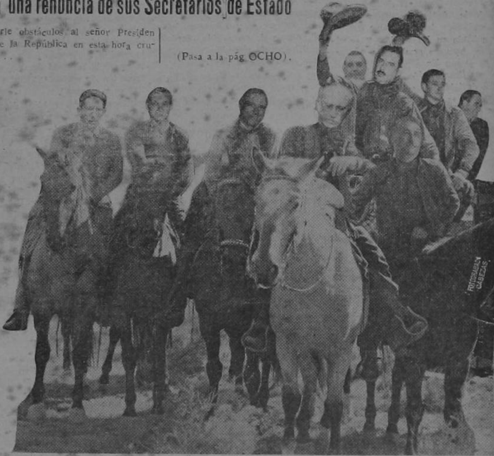
Todos los viejos del gabinete posando ante la poderosa cámara de LA SEMANA, COMICA.