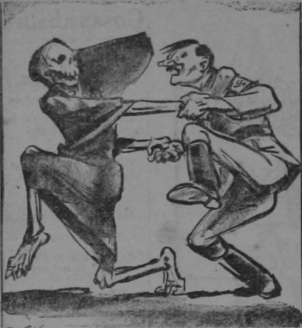
ECHANDO LA ULTIMA CANA AL AIRE.